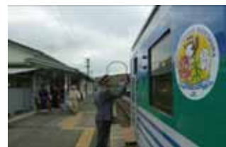
タブレットの受け渡し(イメージ)

JR東日本千葉支社では、鉄道ファンの皆さまに久留里線の古き良き光景を思い出に収めていただくために、閉そく保安機器を使った講習会や撮影会を行う記念旅行商品を販売します。商品には参加者限定記念ピンバッチセットとお弁当付きです。合わせて「記念入場券」もお買い求めいただけます。