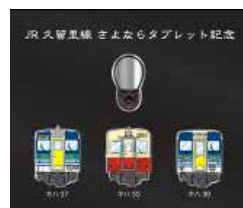
記念ピンバッチセット(イメージ)