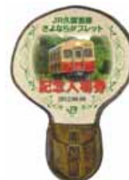
記念入場券台紙(イメージ) ※デザイン色等変わる場合がございます。