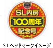
SLヘッドマークイメージ