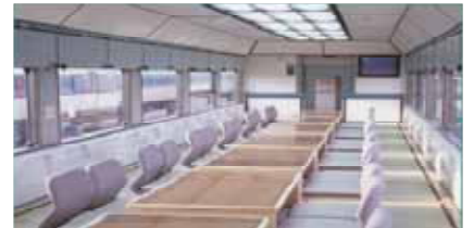
★お座敷列車車内(イメージ)