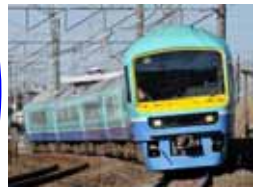
★ニューなのはな外観(イメージ)