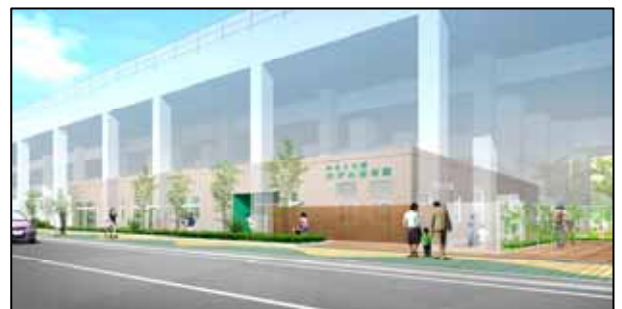
イメージ図につき実際とは異なる場合があります