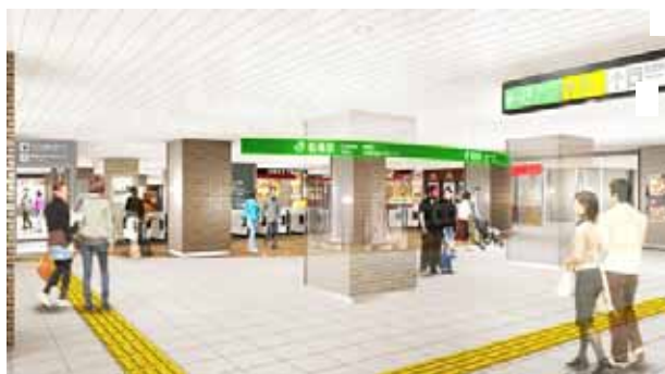
改札外コンコース