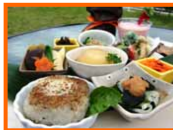
素材の旨みを引き出したヘルシーな品々