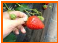
いちご狩り30分食べ放題

おすすめびゅう商品コース 快速バス「うらら号」で行く 「いちごの味比べと南房総の素材そのまま里山ランチ」 南房総で旬のフルーツと野菜たっぷりの里山ランチを楽しむ！！