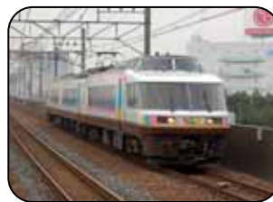
NO . DO . KA

2010年3月13日(土) 14日(日) 20日(土) 21日(日) 22日(月・祝) 「NO . DO . KA」