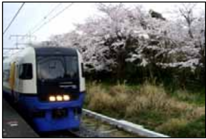
上総湊駅(イメージ)